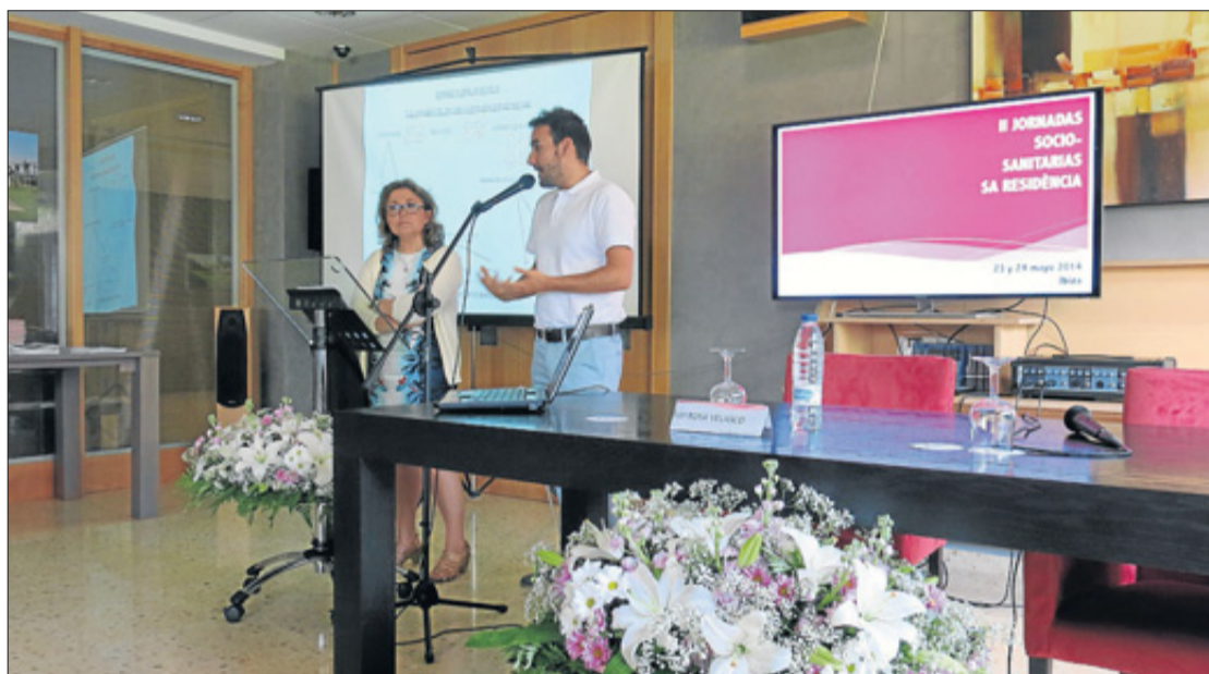
Segunda edición de las Jornadas sociosanitarias celebradas el año pasado.