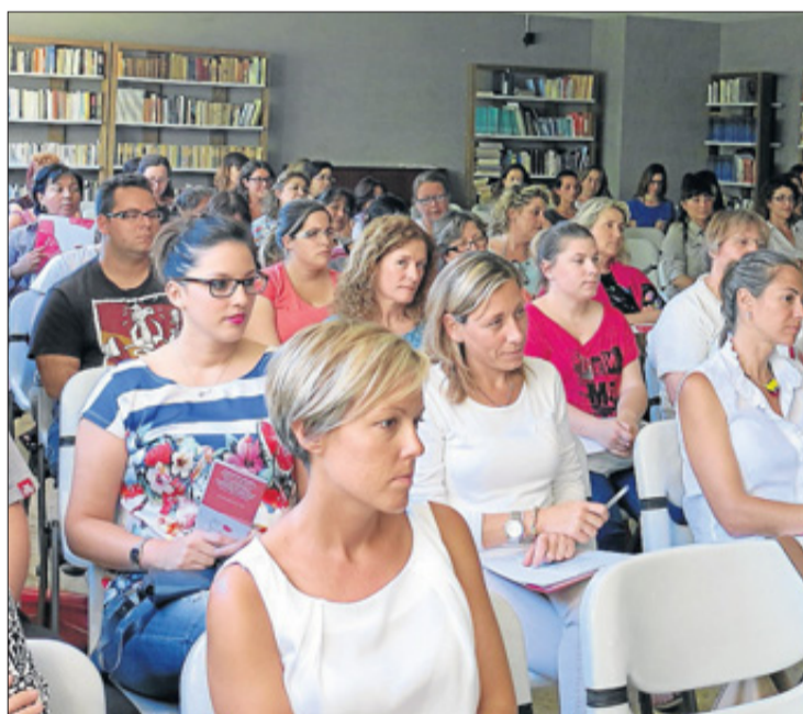
Un centenar de profesionales acudieron a la última edición.

Las inscripciones son gratuitas y libres hasta agotar las plazas existentes y el plazo finaliza el 29 de mayo